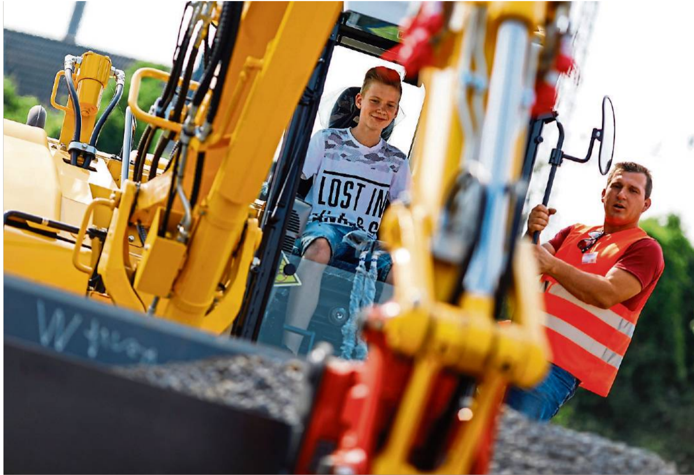
Praxisbezug: Bei der Ausbildungsmesse haben Jugendliche die Möglichkeit, Bagger zu fahren.

Mit vielen Neuerungen möchte das Team von „Ausbildung 49“ den Jugendlichen den Weg in die Berufswelt vereinfachen: Im 30-Minuten-Takt bieten acht Tourguides einen Messerundgang mit verschiedenen Schwerpunkten wie Medien, Naturwissenschaften und Dienstleistungen an. Oft verbänden Jugendliche einen Betrieb mit einer Anzahl bestimmter Ausbildungsberufe, obwohl sie eine viel größere Ausbildungsvielfalt zu bieten hätten. Unternehmen würden darunter leiden: „Der Rund-